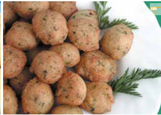
Bunyols de bacallà 500 g 6,40€