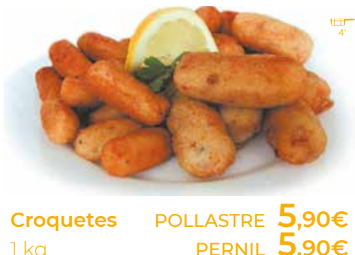
Croquetes 1 kg POLLASTRE 5,90€ PERNIL 5,90€ BACALLÀ 5,90€ MINI PERNIL 500 g 3,70€