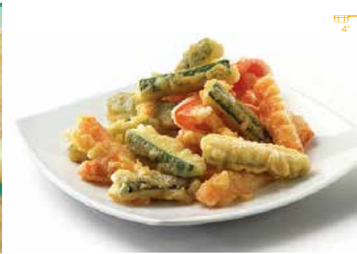
Tempura de verdures 400 g 4,30€