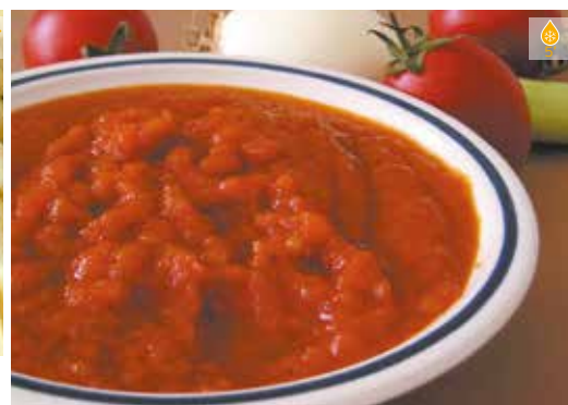
Sofregit de ceba i tomata 250 g 3,60€