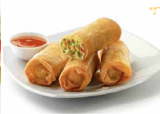
Rotllet de verdures 4 unitats 3,70€