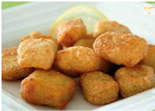
Bocadets de rosada 500 g 6,80€