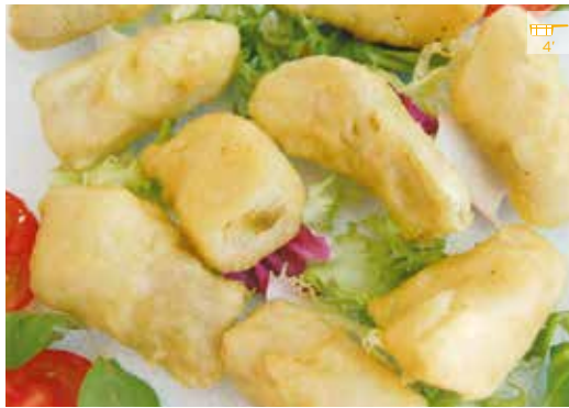
Carxofa arrebossada 500 g 7,20€