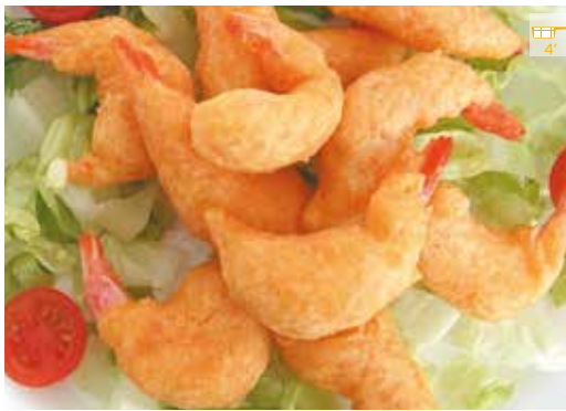
Cua de gamba arrebossada 500 g 11,20€