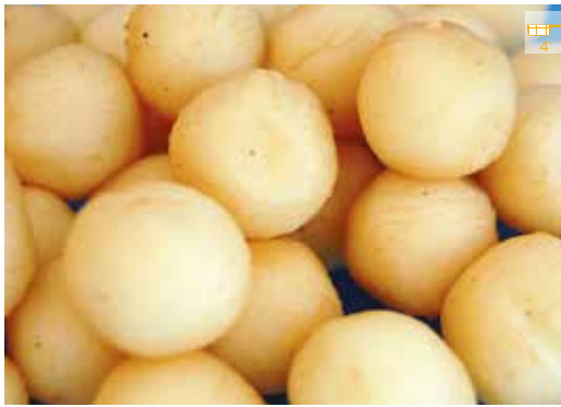
Boletes de patata 1 kg 4,60€